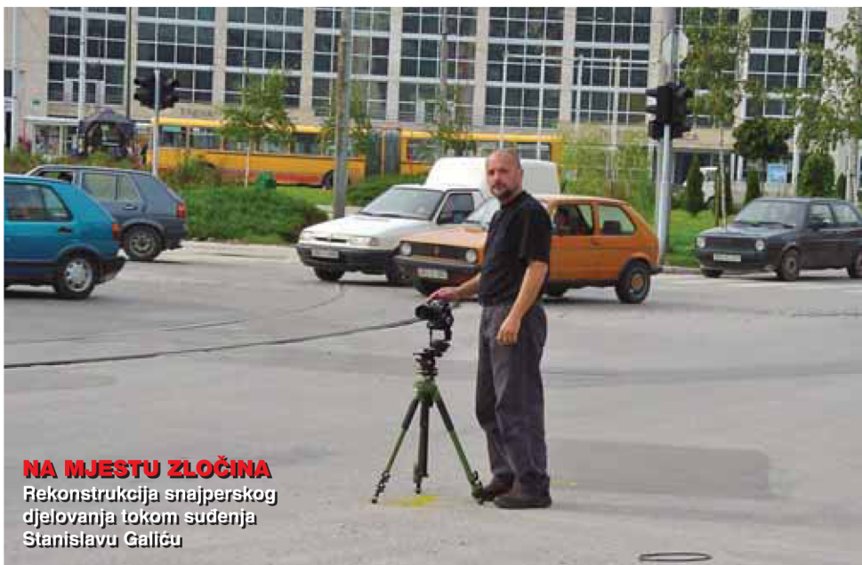
NA MJESTU ZLOČINA Rekonstrukcija snajperskog djelovanja tokom suđenja Stanislavu Galiću